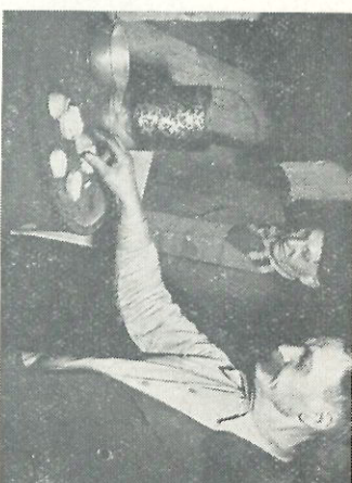
Voor ons: 1944. Voor hen 1954!

Als wij daarover lezen, zeggen we tegen elkaar: „Wat erg, he?" en dan is zo ongeveer ons medeleven betoond.