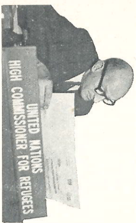
UNITED NATIONS HIGH COMMISSIONER FOR REFUGEES

's-Werelds grootste bedelaar: onverzettelijki