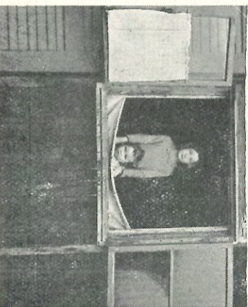
Wij MOETEN wachten op UW daad!

In Griekenland zijn in het totaal 15.841 vluchtelingen.